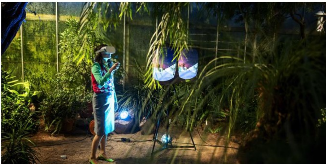
En VR-essä på Göteborgs botaniska trädgård.